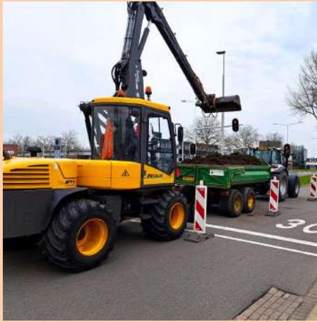
De Mecalac van PolderRealisatie werkt op locatie in Krimpen a/d IJssel.